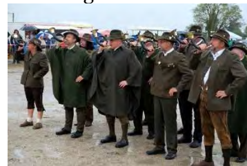
Histor. Festzug Furth i.W.